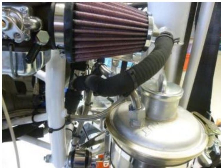
图 8：膨胀箱和水分配管之间的连接，一个散热器在发动机的后部