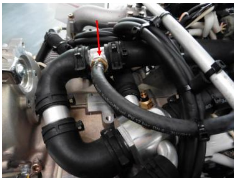
图 2：膨胀箱和最高点在 T 型接头处的连接