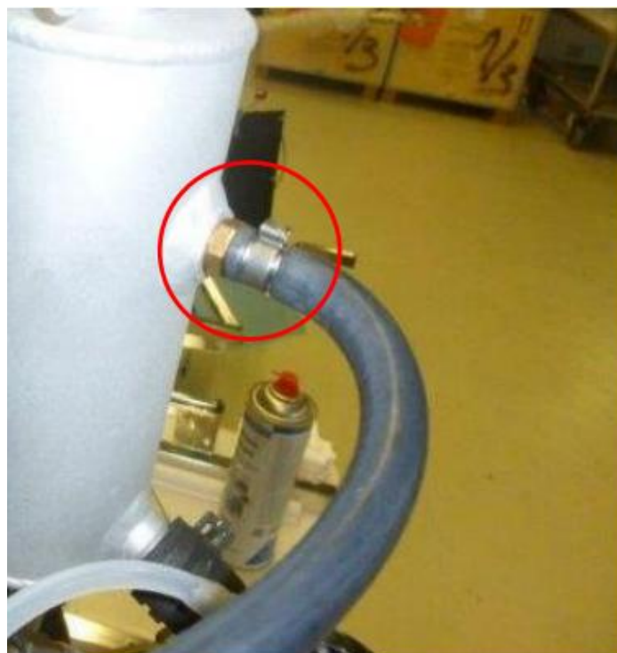
图 4：带铜垫片和夹具的螺纹接套