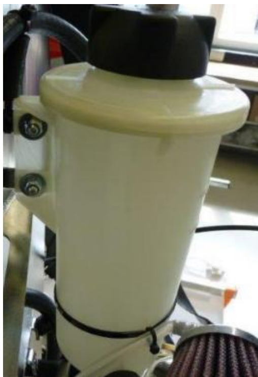
图 3：复合材料膨胀箱 II