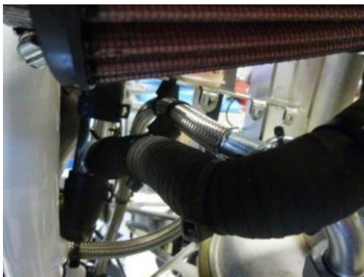
图 9：膨胀箱和水分配管之间的连接，一个散热器在发动机的后部