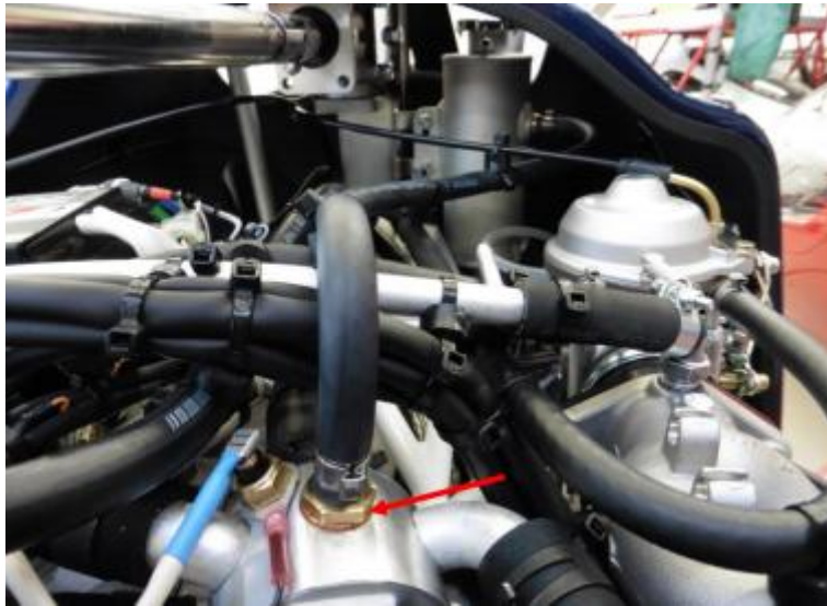
图 7：膨胀箱和最高点之间的连接