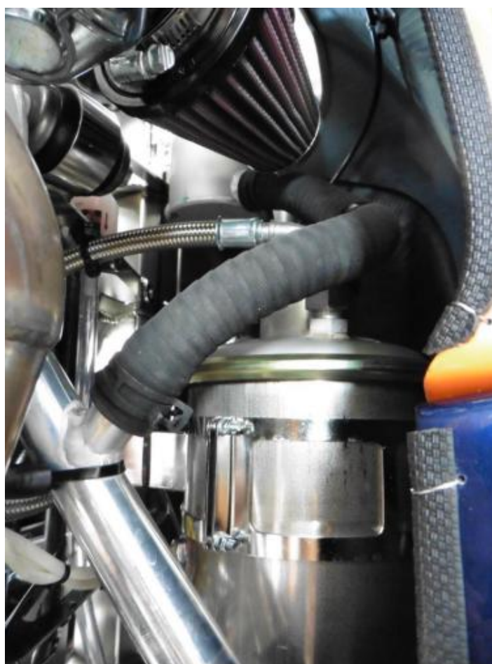
图 10：膨胀箱和水分配管之间的连接，两个散热器在收集器内侧