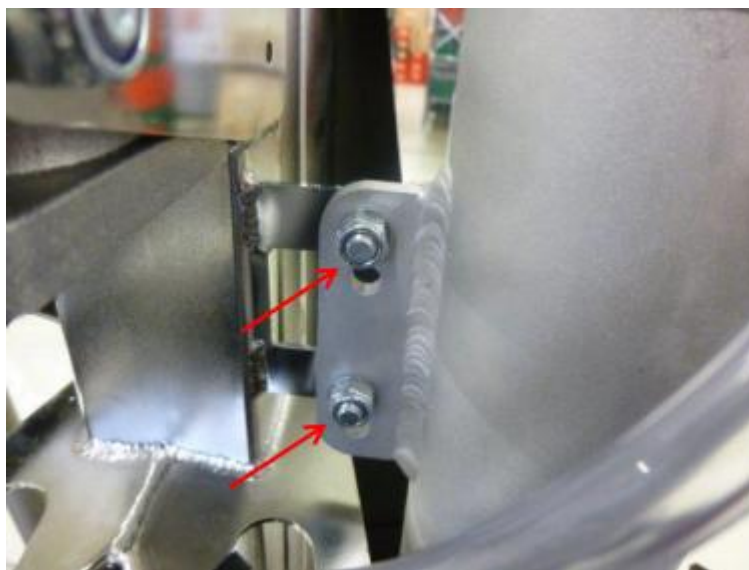
图 5: 安装的膨胀箱 III