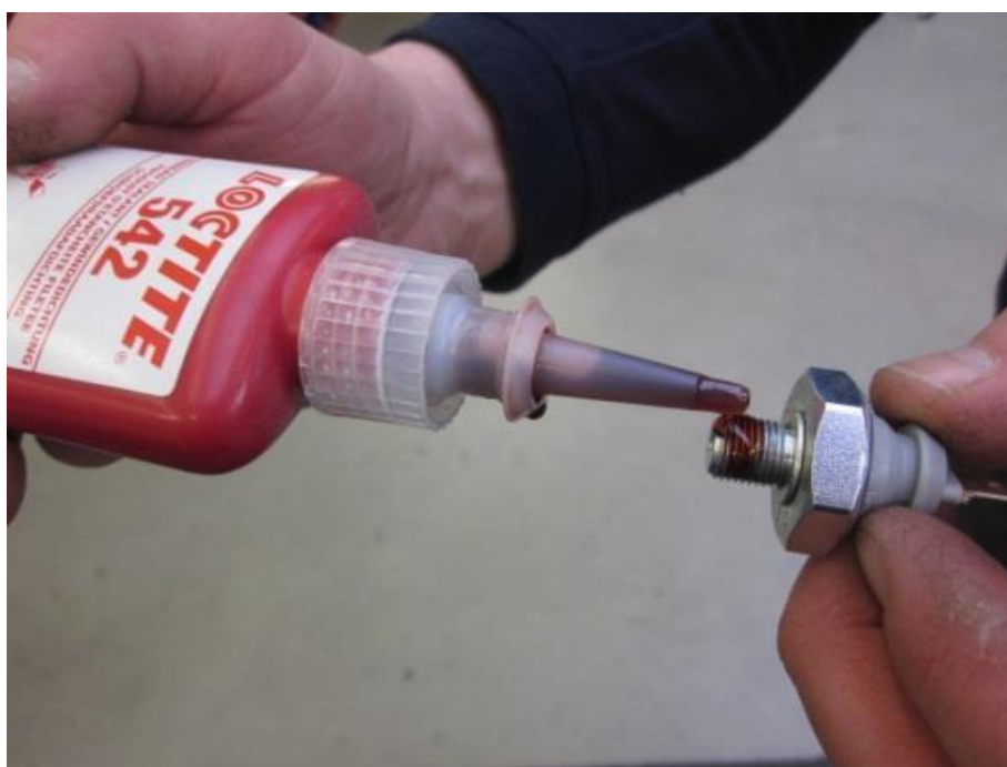
图2 涂Loctite 542胶