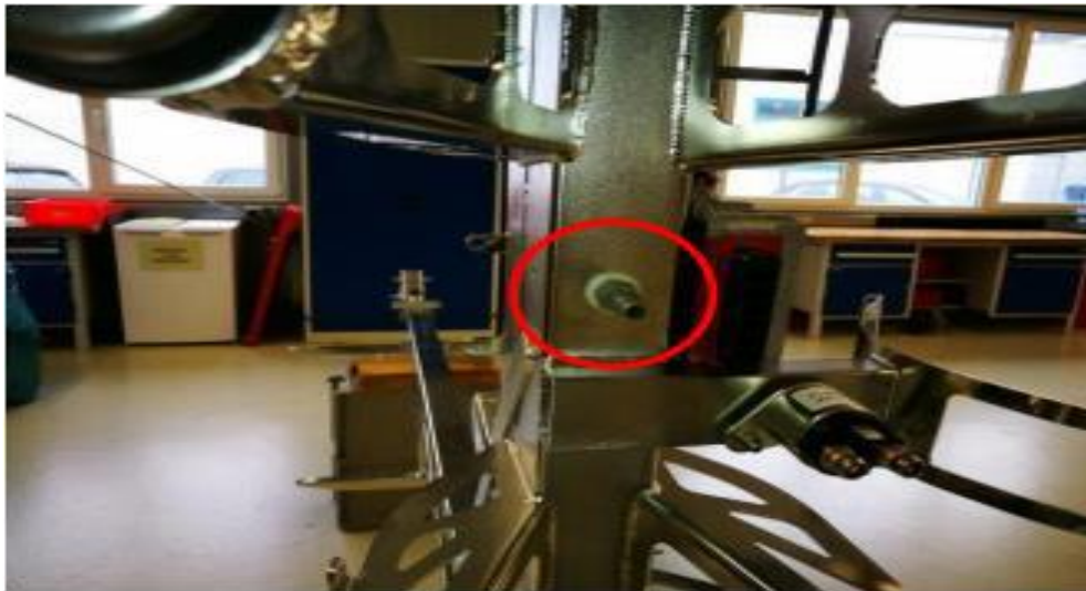
旧的滑油通风口管路

确保在滑油箱附近的软管上有一个开口，其位置与拆下的软管相同。这个开口是为了在飞行中若通风管下部的水分结冰，此开口则能让滑油系统继续通风。