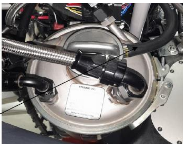
新的滑油通风口管路